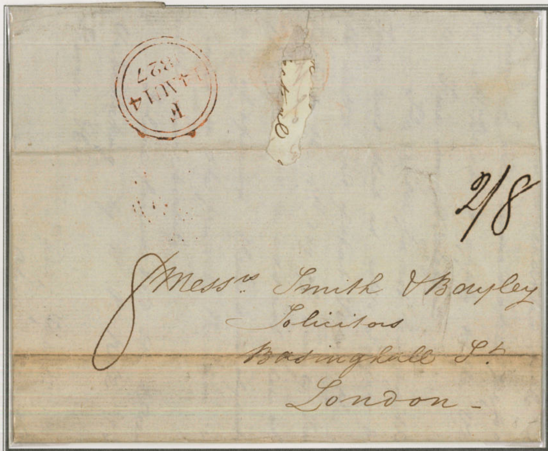
Vorphila-Brief von Battle nach London vom 14. August 1827 taxiert mit 8 Pence + 2 Shilling - 2/8 für 4. Gewichtsstufe 50 bis 80 Meilen 1812 bis 1838

„Wir blicken hier auf mehr als nur eine Marke, Mr. Finch“, erklärt Mrs. Thorne, nun ganz in ihrem Element. „Vor Sir Rowland Hills genialer Idee ist es unmöglich, einen Brief wie diesen vor auszubezahlen. Für einen Brief von Battle nach London musste vom Empfänger ein Tageslohn an Porto bezahlt werden – ein reiner Luxus!“